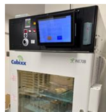
図6. キュービックス®