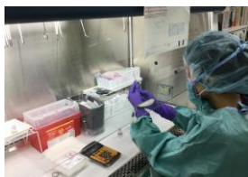
図 10. 外来化学療法部での抗がん薬無菌調製