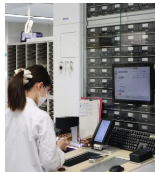
図4. 事務補佐員による自動薬剤ピッキング装置を用いた薬剤取り揃え