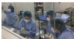
図 14. 無菌調製実習

薬学部実習生の実務実習を年3期、20名前後受け入れています。令和2年5月から愛知県の薬系4大学も含めた受入を開始しました。令和6年度より、実習の進捗状況を実習生と指導薬剤師が共有可能なチェックリストを導入し、実習内容の明確化・指導の均てん化を図っています(図14)。