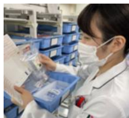
図5. 注射剤調剤および鑑査

定時処方の発行前鑑査を行い、適正な注射剤の供給に努めています。薬の取り揃えには注射剤自動払出装置を使用し、平成26年10月から全日患者施用単位のセット払出を行っています（図5）。タスクシフト/シェアを推進し、薬剤SPD（外部委託）が薬剤の集計・充填・返品作業を担当しています。また、IoT技術を利用した保冷库「キュービックス®、ノヴァム®」を導入し、高額医薬品の厳密な管理を実施しています。（図6）。