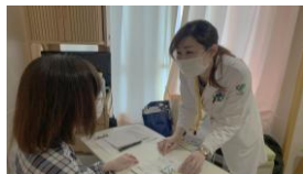
図 11. 入院患者への服薬指導

全病棟に薬剤師を配置し、初回面談から処方支援、服薬指導、副作用モニタリング、退院指導に至るまで、薬に関わるあらゆる状況に可能な限り薬剤師が対応しています。担当薬剤師は、ベッドサイドで薬の適正使用のために必要な説明や、患者さんからの相談に対応しています (図 11)。さらに、医師、看護師に対し適切な処方の提案や、医薬品の取り扱いに関する情報提供も行っています。また、ICU、NICU では担当薬剤師が平日、薬剤投与量等を確認し、注射薬の無菌調製を行っています。