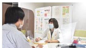
図 12. 入院時持参薬確認

平成 25 年 7 月から病棟薬剤業務実施加算の算定を開始、全病棟で化学療法のレジメンチェックや定期処方への事前確認等を病棟担当薬剤師が行っています。