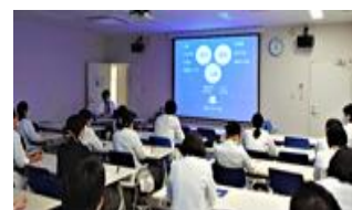
図 13. レジデント講義研修

医療人としての倫理観と責任感を涵養し、チーム医療において高度な臨床薬剤業務を実践できる薬剤師を養成することを目的に、ファーマシーレジデント制度を開設しています。2 年間の研修を基本とし、1 年次は臨床薬剤業務に必要な知識、技能を修得することを目的とし、調剤室、注射剤・製剤管理室、外来診療・TDM 管理室、医薬品情報室、がん薬物療法管理室、麻薬・手術部薬剤管理室、病棟薬剤業務管理室で研修を実施しています。2 年次はさらに高度な臨床薬剤業務を経験し、チーム医療を実践する能力を修得することを目的とし、病棟薬剤業務、チーム医療を主な研修内容としています。令和 7 年度は、2 年次研修に進んだ第 9 期生 2 名、新しく採用した第 10 期生 4 名が研修を行っています。レジデントセミナーや講義研修 (図 13) も定期的で開催しています。