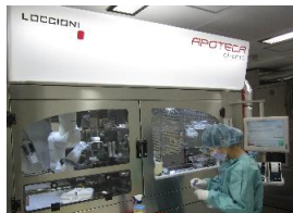
図 9. 抗がん薬自動調製装置 (APOTECA)

療変更時の薬剤説明のみならず、継続治療時の副作用の聴取や支持療法についての指導、副作用予防もしくは軽減のための処方提案、併用薬による相互作用の確認などを行っています。平成 27 年 7 月より、がん患者指導管理料への算定、令和 2 年度 5 月から連携充実加算の算定を開始しています。また、令和 6 年 6 月より薬剤師による診察前外来を実施し、がん薬物療法体制充実加算の算定を開始しています。