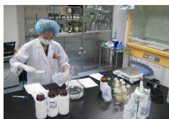
図7. 院内製剤の調製

院内製剤は、市販薬剤で十分な対応ができない場合に医師からの要望に基づき調製する製剤であり、未承認新規医薬品・医療機器評価委員会の承認を得て調製しています(図7)。院内製剤(注射剤・点眼剤等)は品質を確認し、異物試験など試験に合格した製剤のみ供給しています。