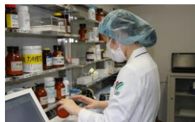
図2. 調剤鑑査システムを用いた散薬調剤

外来処方、平成19年7月より全面院外発行としています。入院処方、処方箋に年齢、体重、腎機能などの患者データを表示し、効率的な処方鑑査を実施しています。医薬品のバーコード照合を用いた調剤鑑査システム（図2）やピッキングサポートシステム（Gx-handly）（図3）、令和4年3月に導入した自動薬剤ピッキング装置（図4）を活用することにより、調剤過誤を防止し適切に医薬品を供給・管理しています。また、タスクシフト/シェアを推進し、自動薬剤ピッキング装置やGx-handlyを用いた事務補佐員による薬剤取り揃えを行っています。