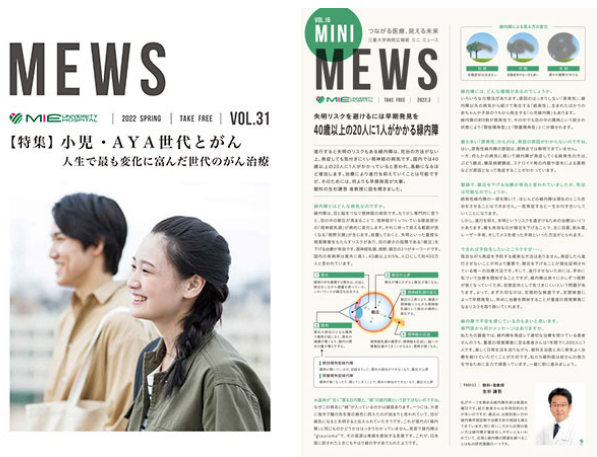
図 1 広報誌「ミューズ・ミニミューズ」

ミューズは「親しみやすく」をモットーに、患者さんご家族を含め、一般の方に当院を広く知っていただくために発行している広報誌です。