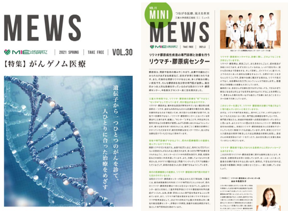
図 1 広報誌「ミューズ・ミニミューズ」

ミューズは「親しみやすく」をモットーに、患者さんご家族を含め、一般の方に当院を広く知っていただくために発行している広報誌です。