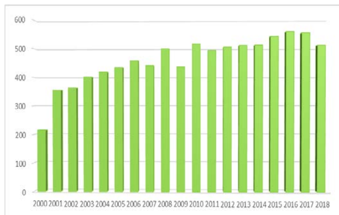
図1 総手術数の年次移：年間約550件の手術数

消化管外科は、上部消化管、下部消化管、炎症性腸疾患の3チーム体制で消化管手術を行っています。年々徐々に手術数が増え、緊急手術を含め年間約550例の手術を施行しています。2017年からは県内初導入の胃癌に対するロボット支援下手術も開始し、食道癌に対しても開始しました。術後早期回復プログラムや臓器別に術後感染モニタリングを行い早期退院、術後感染予防にも取り組んでいます。