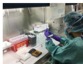
図 10. 外来化学療法部での抗がん薬無菌調製

注射抗がん薬は、職業的曝露に配慮して安全キャビネット(図 10)や抗がん薬自動調製装置(図 11)を用い、無菌的に調製を行っています。