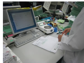
図 3. 調剤鑑査業務