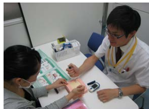
図 2. 外来患者への服薬指導

当院における外来処方箋は、平成 19 年 7 月より全面院外発行されています。院内の窓口では、外来患者へのインスリン・吸入指導や薬に関する問合せへの対応を行っています（図 2）。入院調剤業務では必要に応じて錠剤等の 1 回量包装の実施や、医療事故を防止するためにコンピュータによる調剤鑑査システムの導入や二人以上の薬剤師による鑑査を行うことで、適切な医薬品の供給を図っています（図 3）。