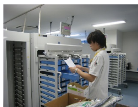
図 4. 注射剤調剤および鑑査

定時処方箋の発行前監査を行い、適正な注射剤の供給に努めています。ピッキングは注射剤自動払出装装置を使用し、平成 26 年 10 月からは曜日に関係なく、患者施用単位で払い出しを行っています（図 4）。また、特定生物由来製品は、対象医薬品のバーコードを読み取り、施用票に基づいた正確な記録と保存を電子的に管理しています（図 5）。