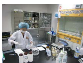
図 6. 院内製剤の調製

院内製剤は、市販薬剤で十分な対応ができない場合に医師からの要望に基づき調製する製剤であり、委員会で承認の得られたものを調製しています(図 6)。院内製剤(注射剤・点眼剤等)は品質を確認し(異物試験・重量偏差試験)、試験に合格したものを供給しています。