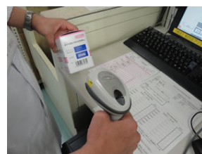
図 5. 特定生物由来製品の調剤