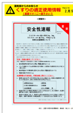
図 7. くすりの適正使用情報

また、「医薬品安全使用のための業務手順書」を毎年見直し、改訂することで医薬品の適正使用に貢献しています。