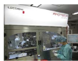
図 11. 抗がん薬自動調製装置