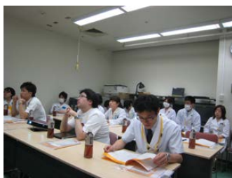
図 12 薬剤部内勉強会

部内勉強会を月 3 回開催し、症例検討や認定・専門資格取得に向けた研修を通じて、知識の共有と向上に努めています（図 12）。