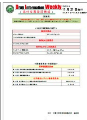
図 8. DI-Weekly

平成 28 年度からは、医療法施行規則の改正に対応し、未承認薬等(未承認薬、適応外使用薬)の使用実態の把握、妥当性(エビデンス等)についての調査を行い、未承認新規医薬品・医療機器評価委員会へ事前調査意見として挙げています。