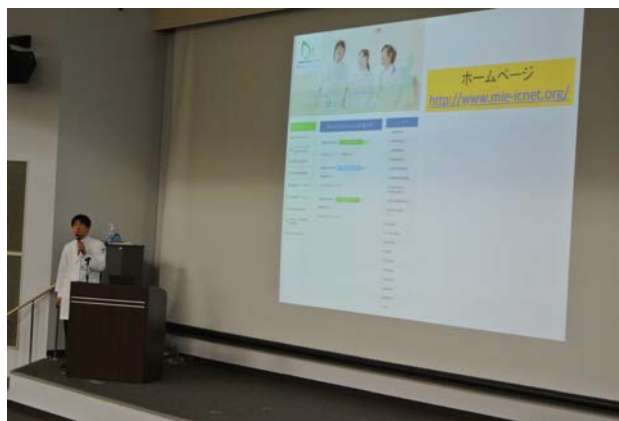
MieICNet 発足説明会の様子