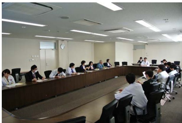
医療安全会議（拡大カンファレンス）：多職種参加のもと、月2回開催しています。議題は多岐に渡り、それぞれの専門性を活かした検討が行われます。