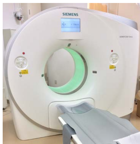
X 線 CT 装置: SOMATOM Force(Siemens)

CT 部門は各メーカーの高性能な CT が揃っており、様々な診療科と連携し、新しい検査法の導入や診断に大きく貢献できるような低被ばくで質の高い検査を行っています。当院では心臓 CT 検査を積極的に行っており、低被ばくで冠動脈狭窄から心筋虚血を一度に診断できます。この検査を行えるのは全国でも数施設です。また、一般的な検査においても再現性の高い検査結果を提供し、経過観察や治療効果判定に寄与しています。