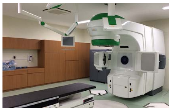
放射線治療装置 : Novalis Tx (Varian/BrainLAB)

○強度変調放射線治療（IMRT）：49 例、○密封小線源治療：43 例（子宮頸部 40 例〔組織内照射 3 例含む〕、肺 2 例、食道 1 例）○前立腺がん内照射療法：19 例、○定位放射線治療：頭部 3 例、体幹部 11 例、○術中照射 4 例、○全身照射 12 例。