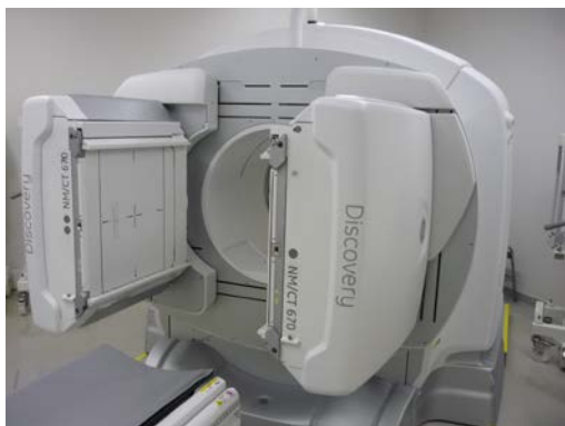
SPECT/CT 装置 : Discovery NM/CT 670(GE)

その他、神経内分泌腫瘍を対象とした新しい放射性医薬品を用いた検査も始めています。