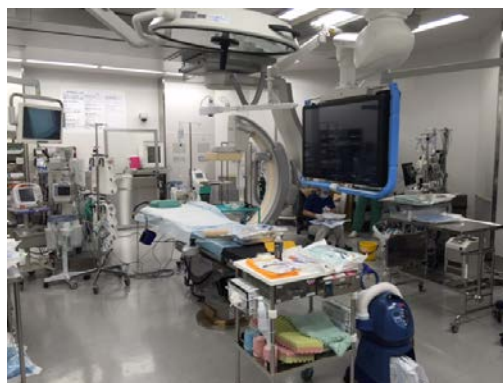
HybridOR(Ope@室) : Allura Clarity FD20(Philips)

血管撮影部門は血管撮影室 4 室とハイブリッド OR の 5 室で運営しています。新たに導入されたハイブリッド OR では従来の血管撮影室では対応できなかった開頭術+血管撮影、椎体固定術時の Corn Beam CT 撮影、さらには TAVI など従来以上に様々な治療に対応できる体制を整えました。頭頸部の疾患に対するコイル塞栓術やステント留置術、心疾患に対する経皮的冠動脈拡張術、大動脈疾患に対するステントグラフ内挿術などの治療も的確に施行できるようシステムを構築しています。