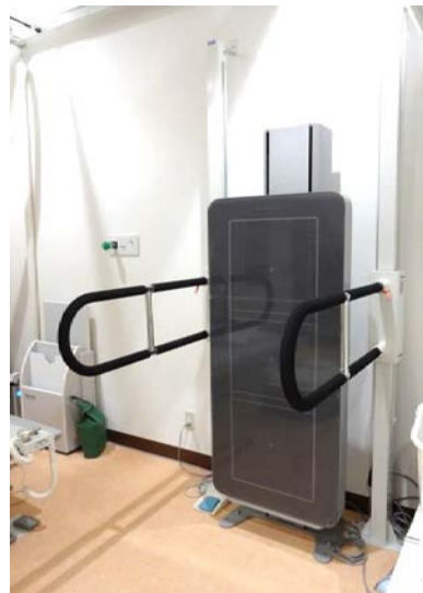
デジタル X 線画像診断装置: FUJIFILM DR CALNEO GL(FUJI)

その他、マンモグラフィや骨密度測定、透視検査などにおいても、患者さんに合わせた検査、有益な撮影技術の習得を進めています。