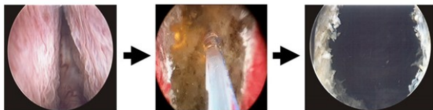
レーザーにより前立腺が蒸散され、尿道の閉塞が解除される