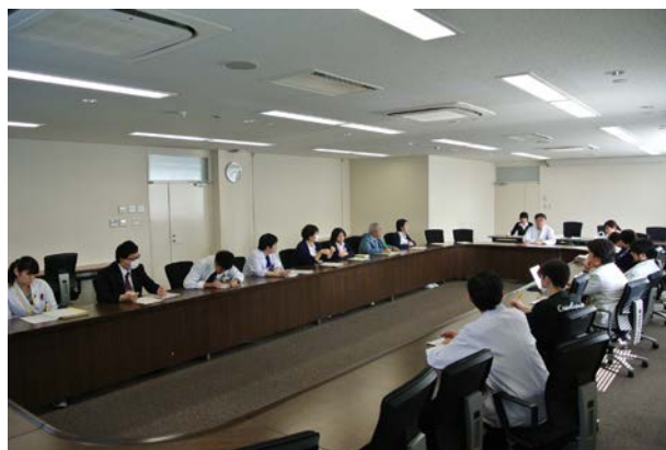
医療安全会議 (拡大カンファレンス) : 多職種参加のもと、月 2 回開催しています。議題は多岐に渡り、それぞれの専門性を活かした検討が行われます。