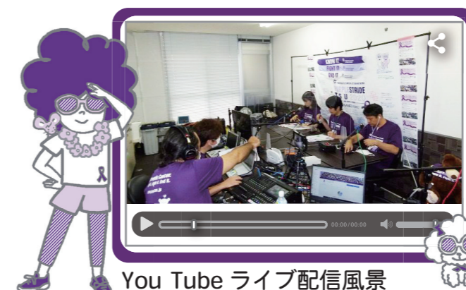
You Tube ライブ配信風景