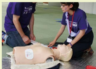
Reported by 坂口あんり

BLSとはBasic Life Supportの略で「一次救命処置」のことです。このコーナーでは、AEDや心臓マッサージが体験できます。もしもの時のために、1度体験してみませんか?どんな方でも体験することができますので、お気軽にお越しください。