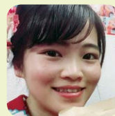
Reported by 中村麗奈