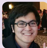
Reported by 小野滉介

パープルリボンウォークは、クイズを解きながら行きます。ぜひ、三重大学の自然と文化に触れながら、お楽しみください!