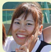
Reported by 山本真優

三翠ホールは貝殻が屋根の形をした講堂で、入学式や卒業式など、全学部の様々な行事に使用します。パープルリボンウォークではスタート&ゴール地点になっています!!