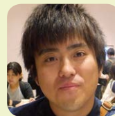
Reported by 清水康太

環境・情報科学館はMEIPL館とも呼ばれ、食事や勉強の場として親しまれているほか、研究活動や環境活動に関する情報発信の場としても利用されています。