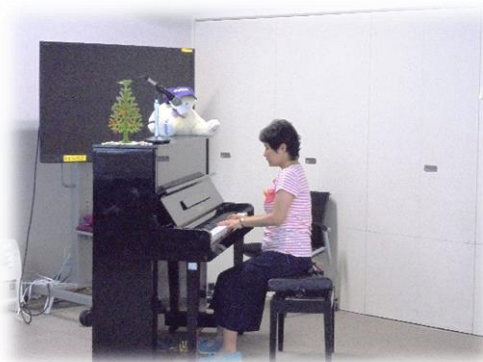
〈森本さんのピアノ演奏の様子〉

今回もたくさんの方にご参加いただき、スタッフ一同大変うれしく思っております。皆様、次回も楽しみにしててください。