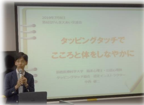
〈タッピングタッチの様子〉