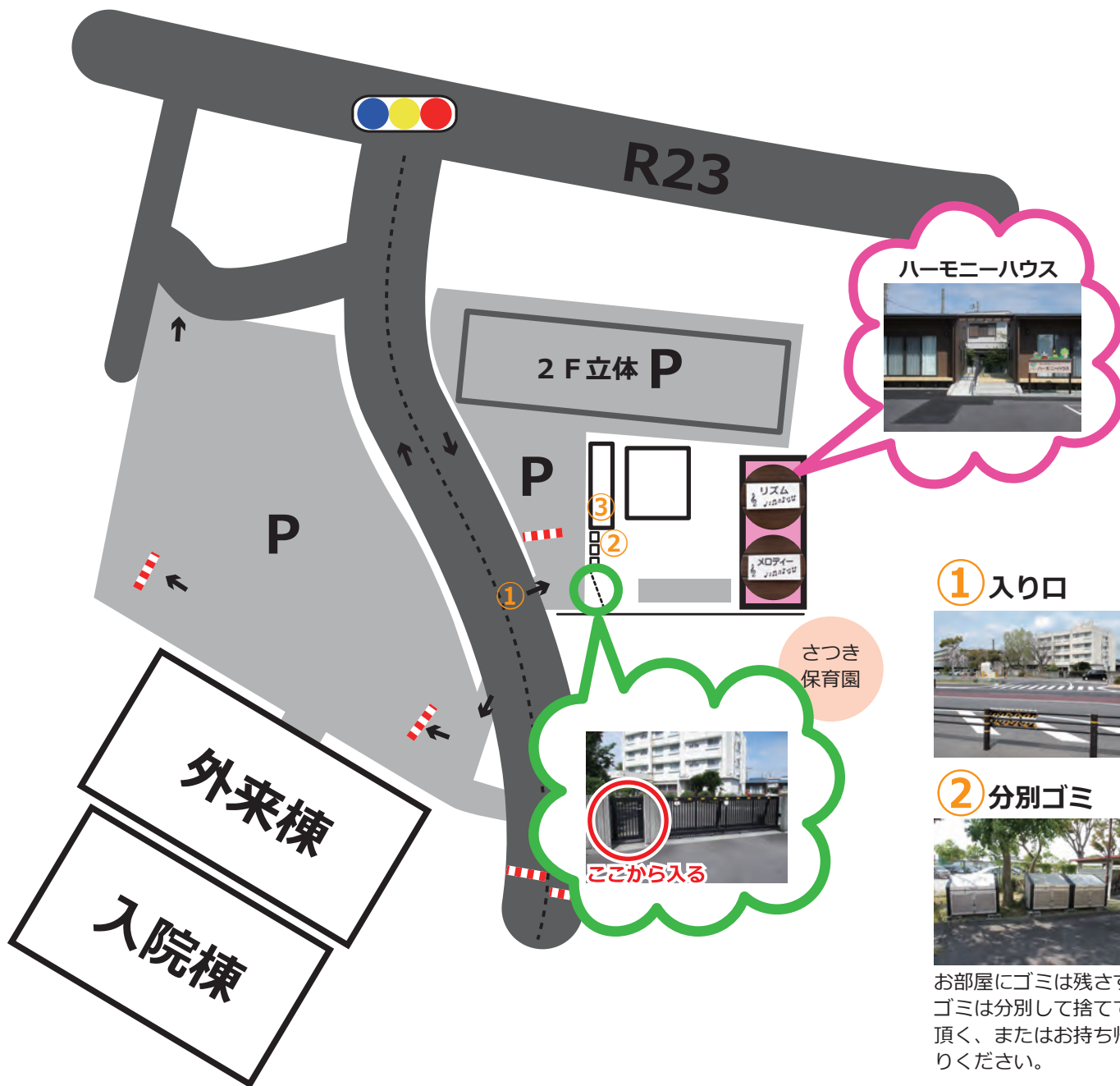
ハーモニーハウス