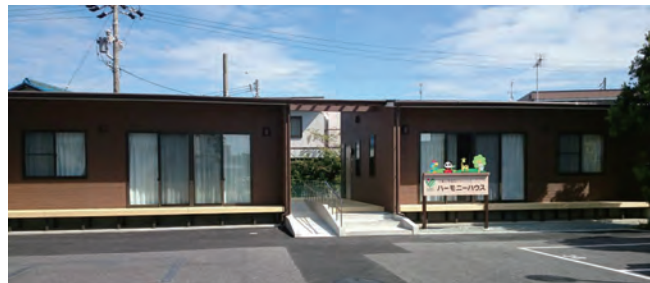
ハーモニーハウス正面